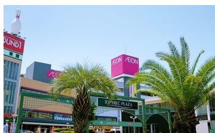
トビレックプラザ(同 10 分)