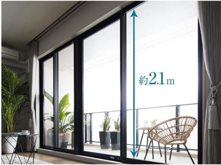
約 2.1m のハイサッシュ