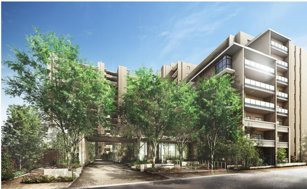
完成予想 CG パース