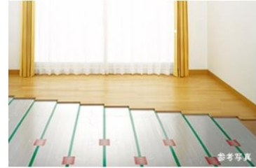
ガス温水式床暖房