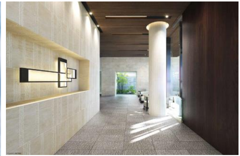
(左)外観・(上)ロビー (下)プライベートガーデン