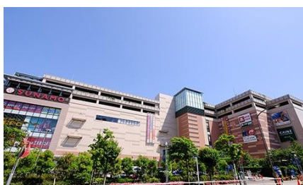
SUNAMO(徒歩 9 分)