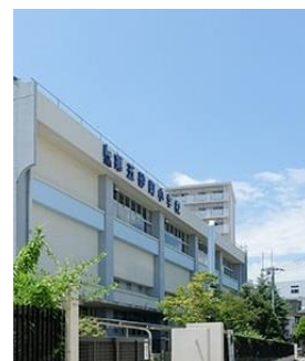
第五砂町小学校 (同 2 分)