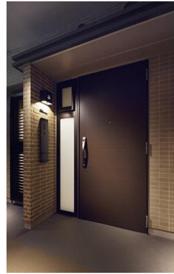
玄関袖壁・庇・通風窓